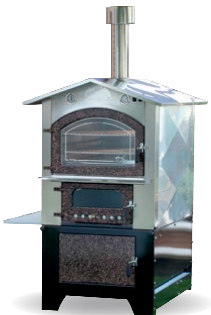
GIOVE KTM 60/80/100 tutto inox satinato