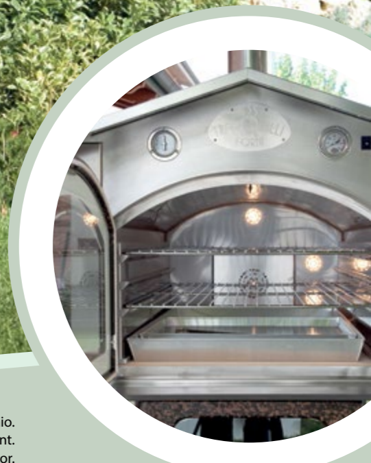
Particolare frontale in acciaio. Detail steel front. Insbesondere Stahl vor.