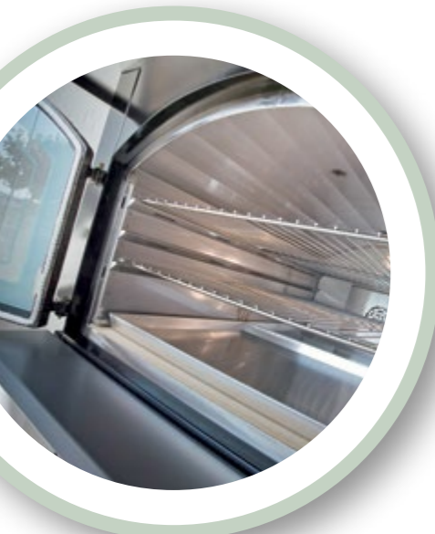
Particolare della camera di cottura. Detail of the cooking chamber. Kochraum.

Dies ist der größte Ofen im Sortiment, das Musterstück der Firma Tranquilli Forni mit seinen drei Kochebenen mit einer Breite von 65 cm. Natürlich erlaubt ein solcher Ofen eine große Menge an Gerichten gleichzeitig vorzubereiten. Alles wurde im kleinsten Details gepflegt. Vom Stahldach dass eine große Lebensdauer garantiert, das Design, die eleganten Farben und der Funktionalität der Kochkammer. Die Seitenwände der Kochkammer sind mit zwei Schamotteplatten ausgestattet die wiederum von zwei ausziehbaren Innoxpaneelen gedeckt sind. Durch diese Paneelen kann auch die Höhe der Grills bestimmt werden. Es ist der geeignete Ofen für Veranstaltungen, Pizzeria, Restaurant und vieles mehr.