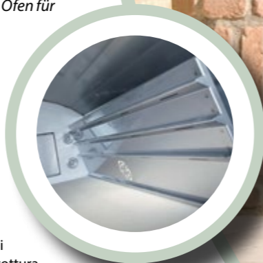
Pareti estraibili nella camera cottura. Removable walls in the cooking chamber. Seitliche Wände der Kochkammer ausziehbar.