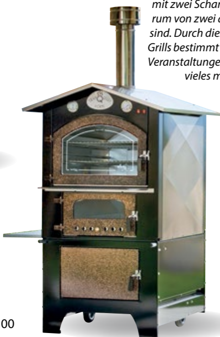
GIOVE KTM 60/80/100